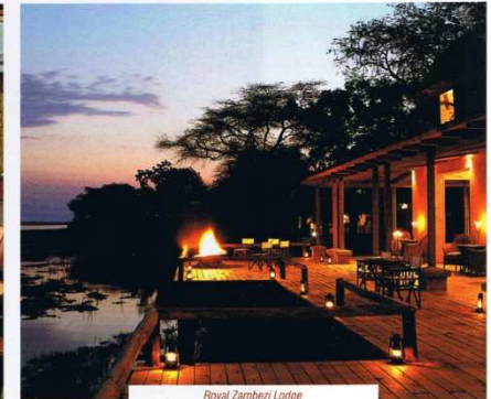
Royal Zambesi Lodge